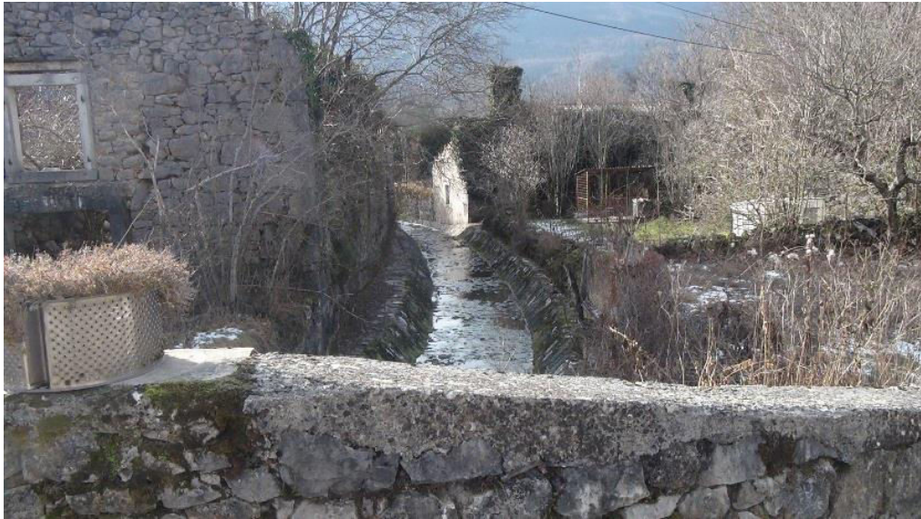
Uređeni vodotok i kameni most u Danama