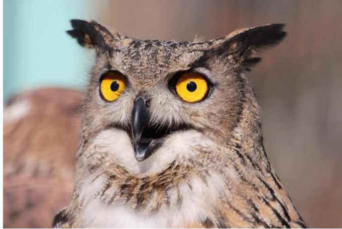
Velika ušara ( Bubo bubo )