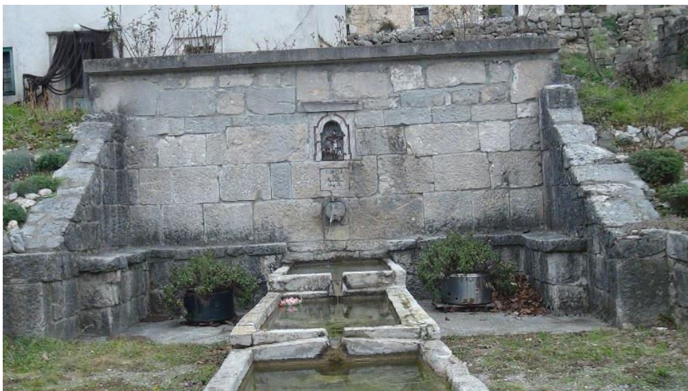
Kaptažna građevina izvora vode u Podgaćama