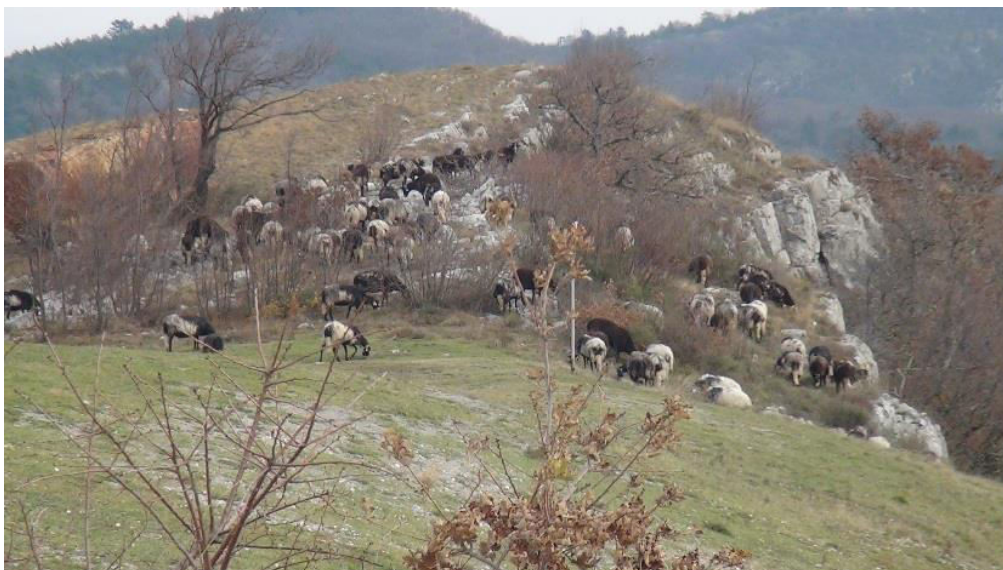
Stado ovaca – Krančamelje